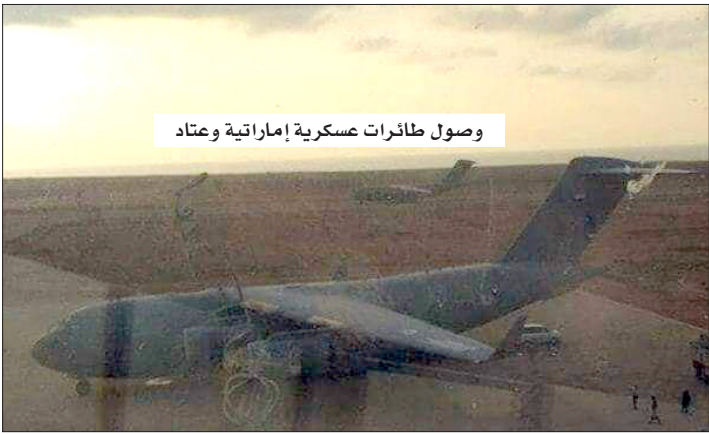
وصول طائرات عسكرية إماراتية وعتاد

يؤكد مراقبون أن الفار هادي يدرك أهمية جزيرة سقطرى للأمركيين الذين يتخذون من الإمارات غطاءً لتخرُّكاتهم في الجزيرة اليمنية الاستراتيجية؛ ولأنها كذلك يستغل الفار هادي ورقة سقطرى؛ كونه معترفاً به دولياً للإبقاء على سلطته وفرض نفسه في اللعبة السياسية في ظل المخاطر التي تتهدد سلطته عبر الإمارات التي تشكل مليشيات في المحافظات الجنوبية وتطرد قوات الفار هادي وآخرها ما حدث في أبين،