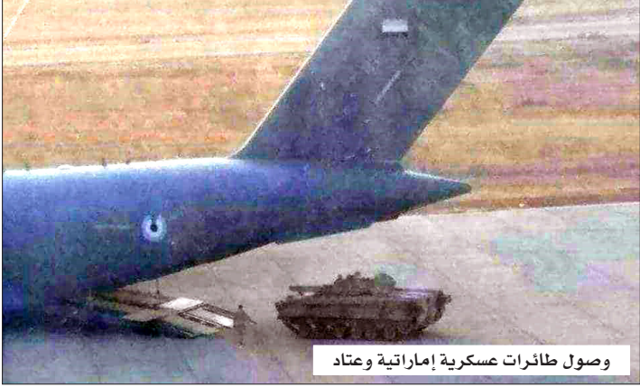
وصول طائرات عسكرية إماراتية وعتاد