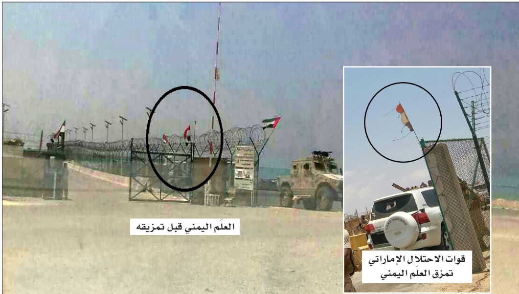
العلم اليمني قبل تمزيقه

قبل عدة أسابيع، أثار الإعلام الإماراتي جدلاً واسعاً إثر تناوله وجود علاقات