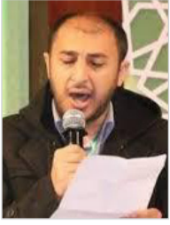
من قصيدة (نبض أوّاه) الشاعر / حسن المرتضى

أشكو إلى سيدي من أمة حشدت ضدّ اليمانيين باسم الله أشقاها كأنما كرز التاريخ (أرطاة) أو (ملجم) العصر إذ سلمان أشقاها بك انتصرنا على قبيل عاصفة إلهها النفط والدولار أغواها بك انتصرنا عليهم إذ بنا وثبت أمجاد أنصارك الأخير يا طه