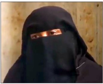
والدة أحد الأطفال الضحايا:

- المغتصب هدد ابني بالقتل وقال له «أنت مش أول واحد»